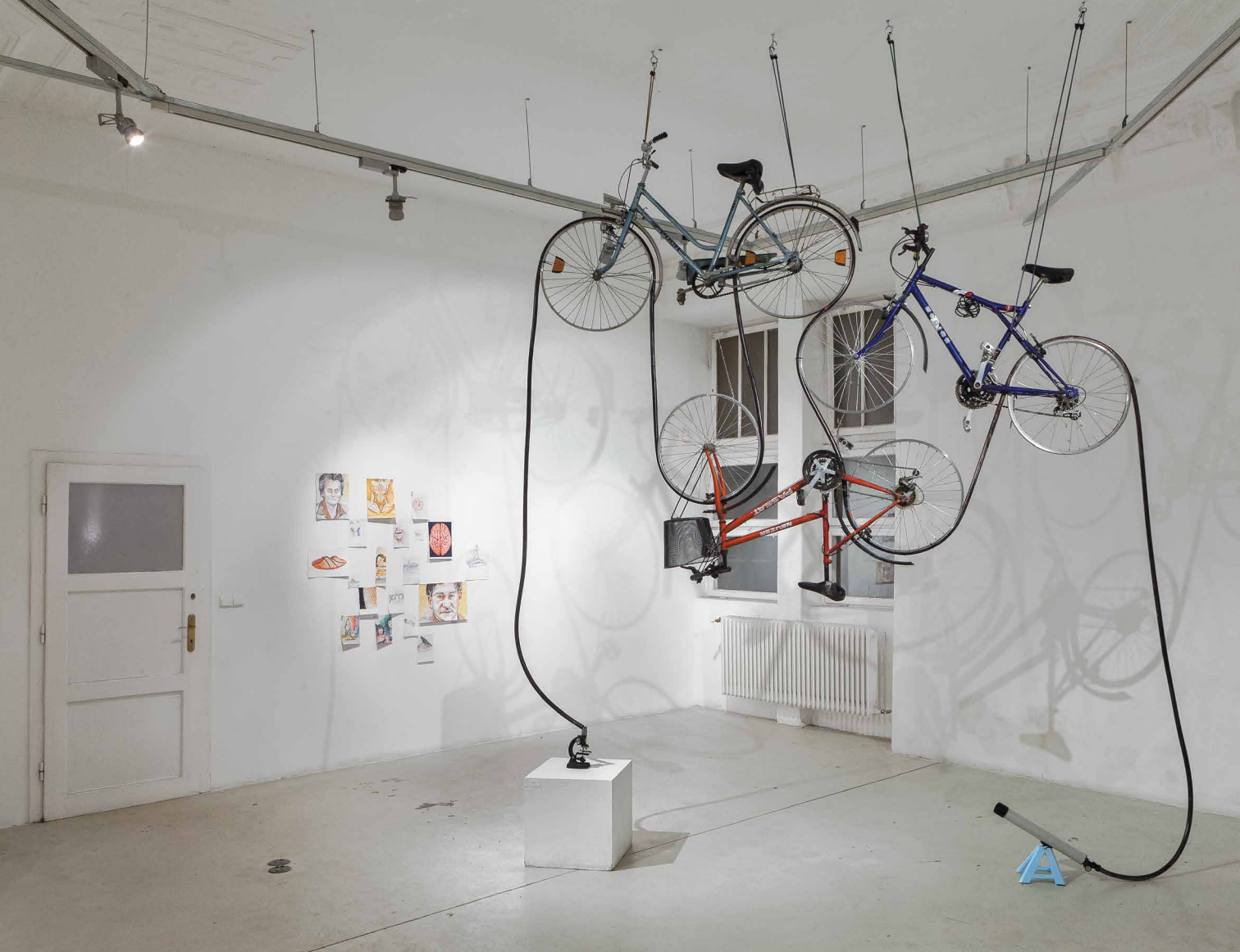
PACSIKA Rudolf: Tériszony | Agoraphobia, 2010 kerékpárok, gumi, mikroszkóp, csillagászati távcső | bicycles, rubber tube, microscope, astronomical telescope