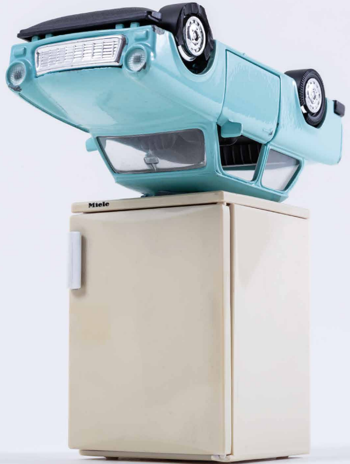
PACSIKA Rudolf: Túlélés emlékmű | Survival memorial, 2002 objekt | object

A „hatalom” lényege – hogy a kultúra mit enged látni, érezni és tudni, vagy, hogy mi az, amit korlátoz, vagy tilt látni, érezni, tudni. Az elfogadható, hogy a kultúra erőteljesen alakítja azt a valóságot, melyben az emberek tevékenykednek, és ezt a valóságot kritikus szemmel méregeti: miért van ez