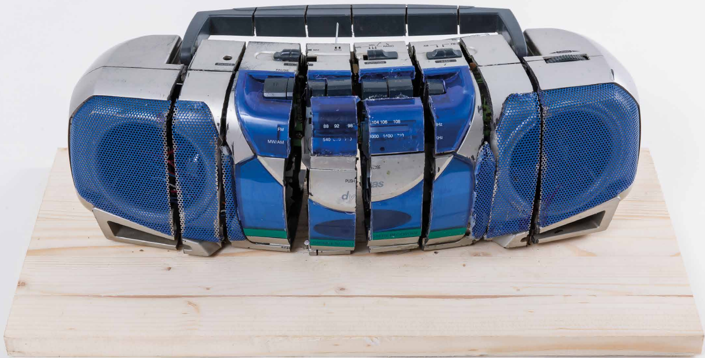
PACSIKA Rudolf: Meghajlított rádió | Bent radio, 2009 objekt | object