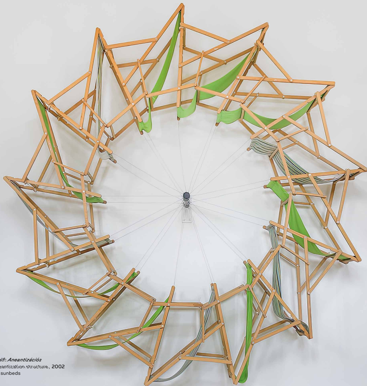
PACSIKA Rudolf: Aneantizációs szerkezet | Aneantization structure, 2002 napozóágyak | sunbeds