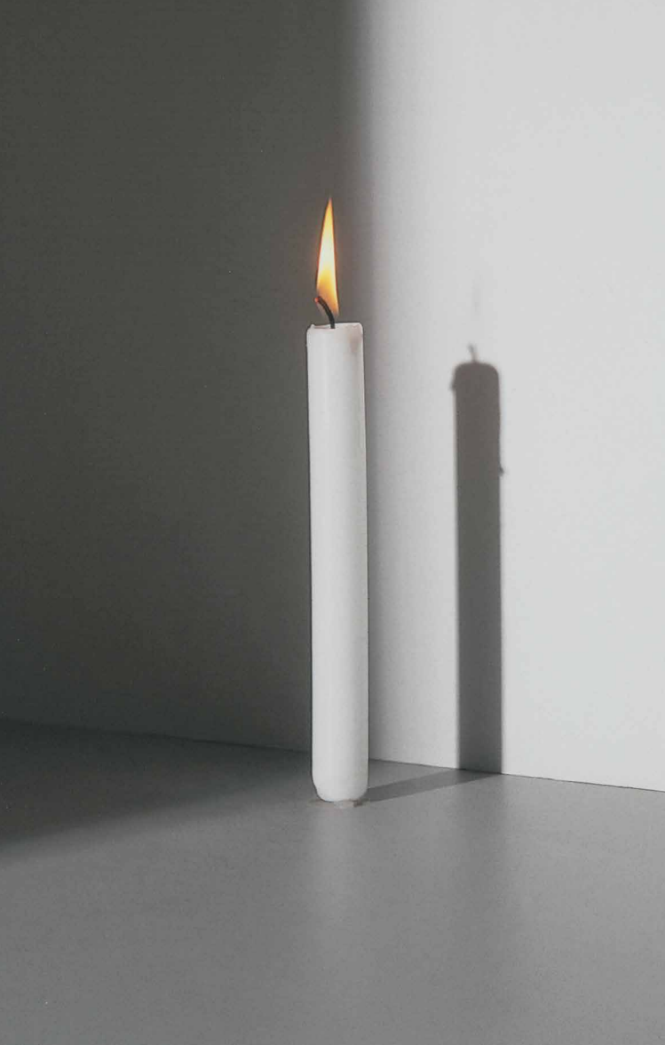
PACSIKA Rudolf: Cím nélkül | Untitled, 1995–1996 fotó | photo, 40 x 50 cm, részlet | detail

és miért nem más? Fontos megjegyezni, hogy ez a nézőpont részben különbözik attól a szemlélettől, amely a kultúrát misztifikálásnak tekinti.