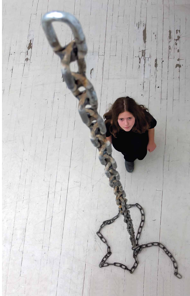
PACSIKA Rudolf: Cím nélkül | Untitled, 2000 hegesztett lánc | welded chain