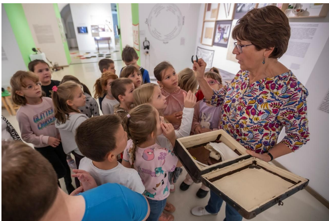
Második osztályosok a kiállításban