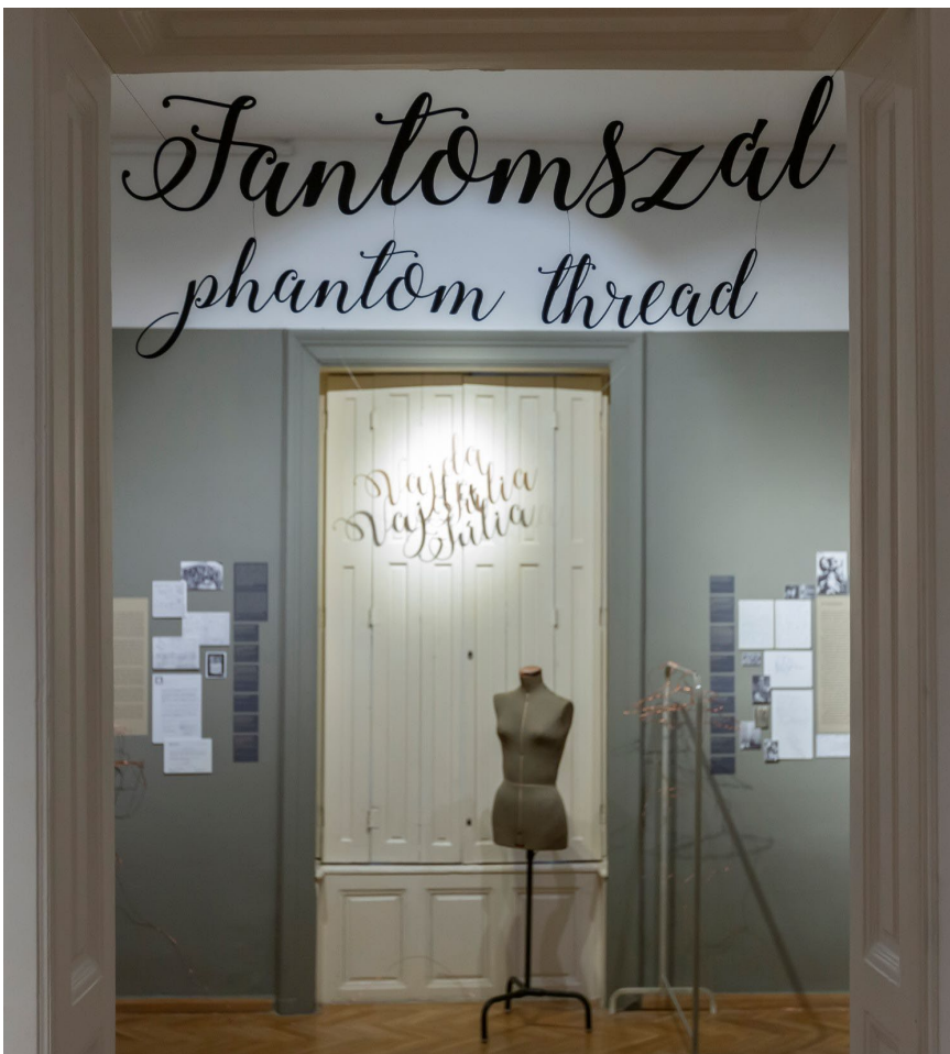
Enteriőrkép a kiállításból