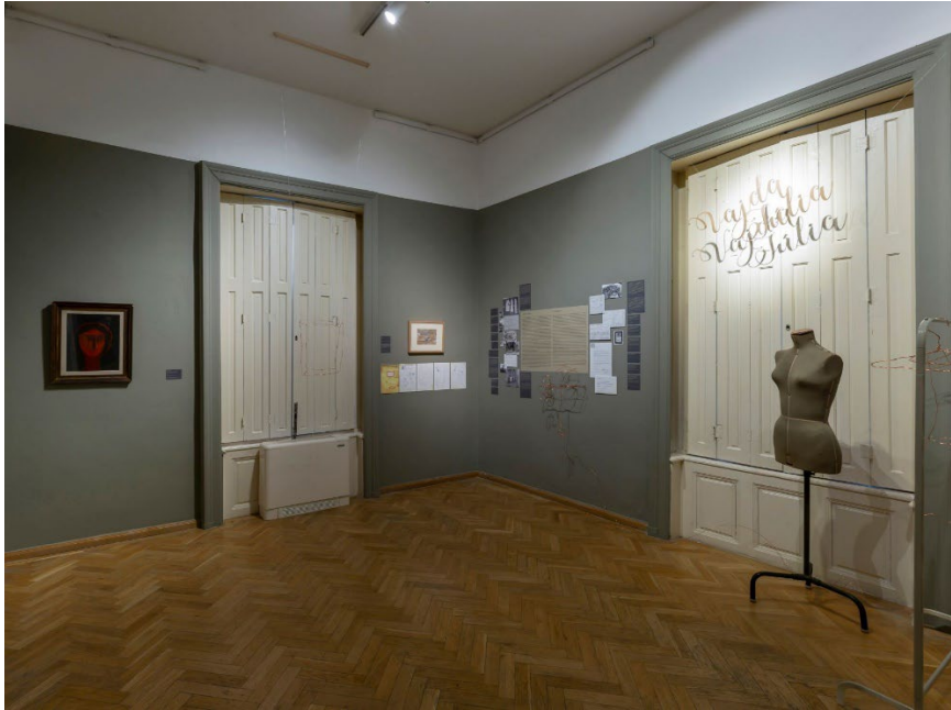
Enteriőrkép a kiállítástól