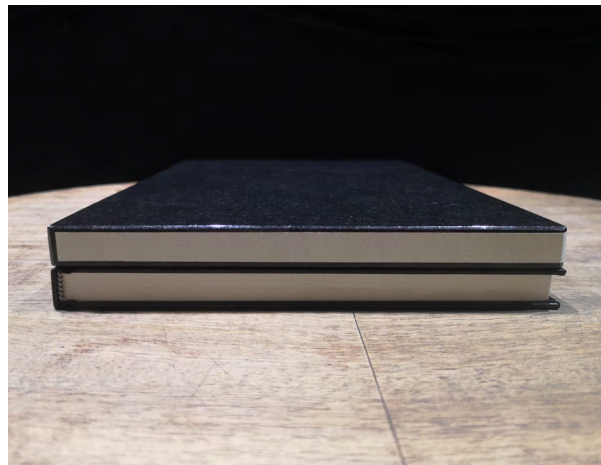
ERDÉLYI Gábor: Két napló | Two Diaries , 2022, gránit, akril, papír | granite, acrylic, paper , 30,3×21,6×4 cm