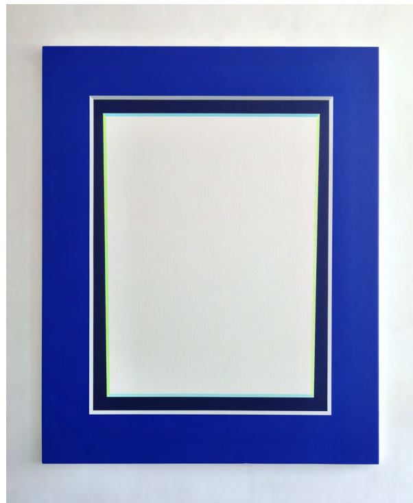
ERDÉLYI Gábor: Egyenlő szárú fordított trapéz kék paszpartuja | Blue Passpartout of the Inverted Isosceles Trapezoid , 2021, akril, vászon | acrylic on canvas, 100×80cm