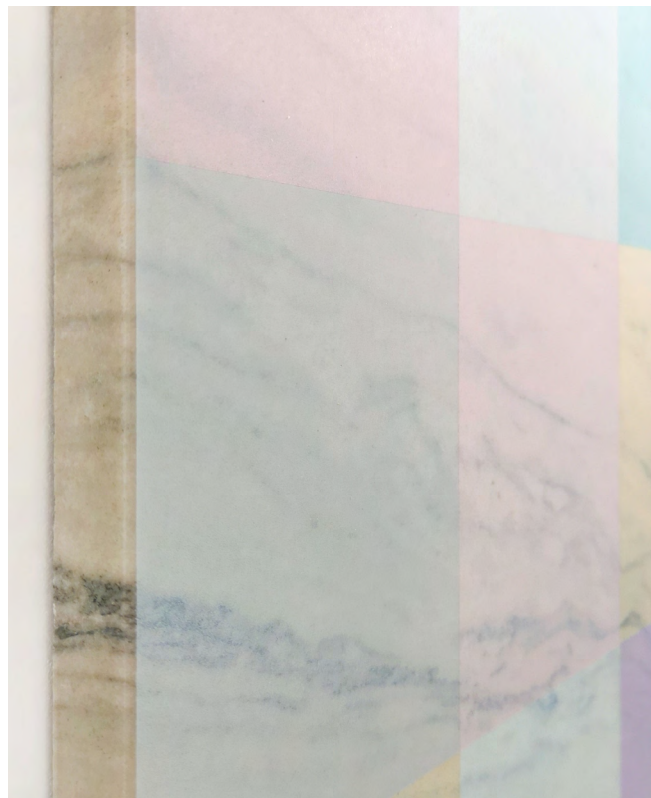
ERDÉLYI Gábor: Kilátás a márványra | View of the Marble , 2022, akril, márvány | acrylic, marble , 60x45x2,3cm