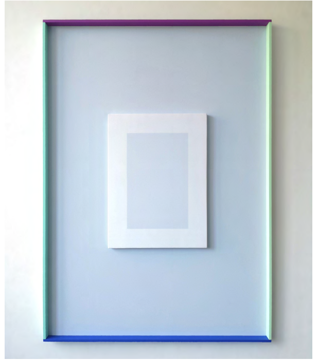
ERDÉLYI Gábor: Középen | In the Middle , 2021, akril, fa, selyem | acrylic, wood, silk , 113×80cm