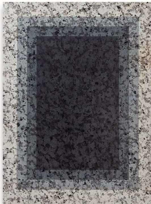
ERDÉLYI Gábor: Kő mélysége | Stone's Depth , 2022, akril, gránit | acrylic, granite, 60×45×2cm