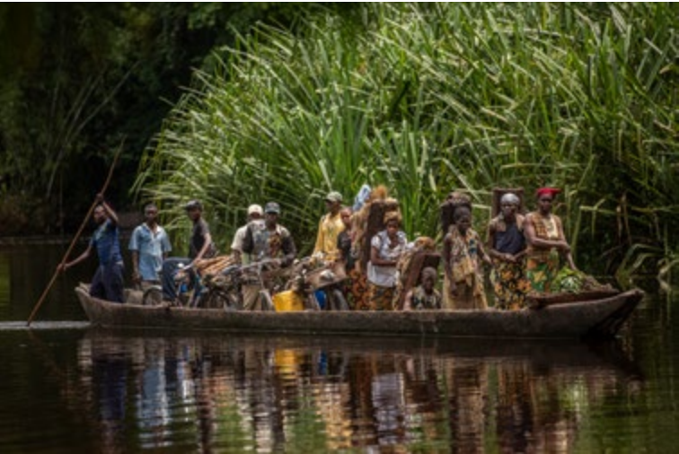
Hajdú D. András: Cataracta, 2015