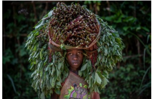
Hajdú D. András: Cataracta, 2019

relief the contrast between the Edenic scenery of the Congolese rainforest and the deprivation, vulnerability and everyday struggles of the people who live there. András D. Hajdú introduces us to this world through a highly distinctive, personal stance. Emotions, bonds, mutual dependence, loneliness, carefreeness and all-pervading joy also feature in these humane photographs, allowing insights into deeper, less conspicuous layers of life in the DRC.