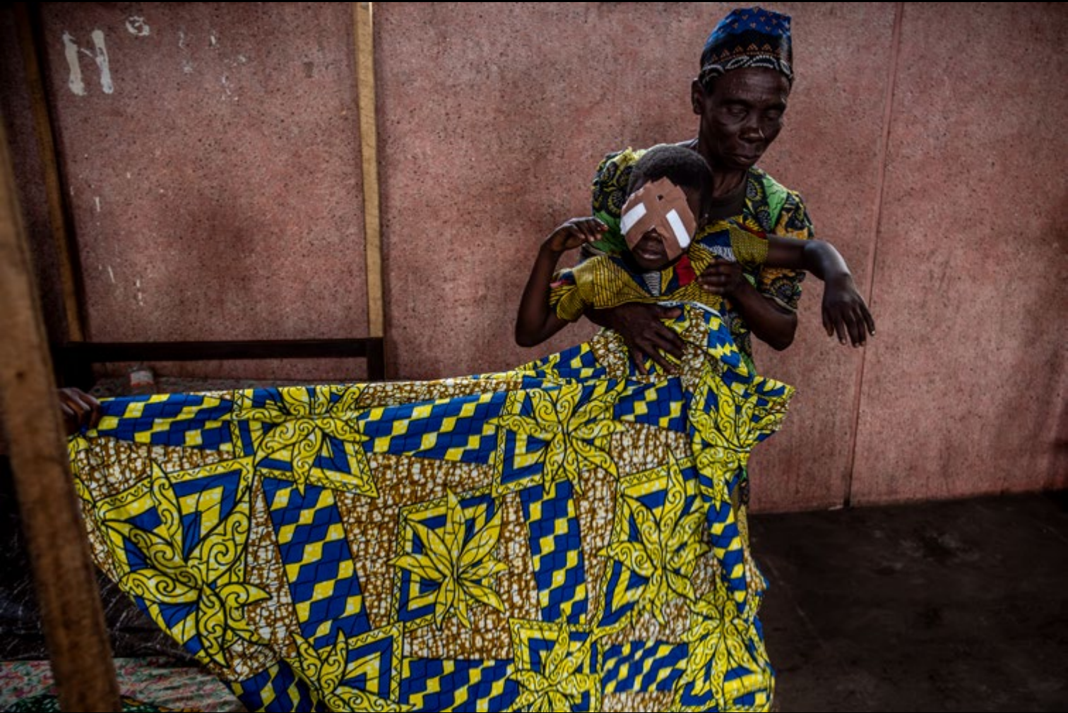
HAJDÚ D. András: Cataracta, 2015