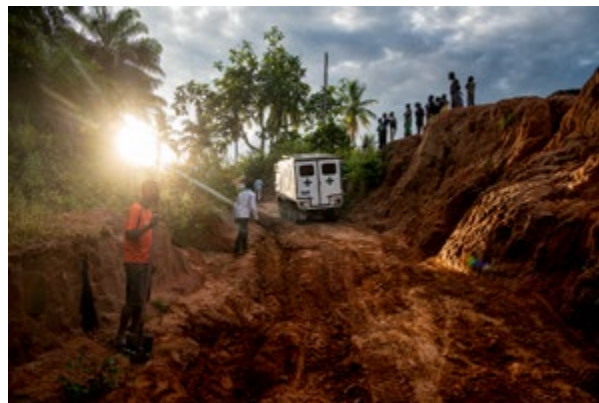
HAJDÚ D. András: Cataracta, 2022