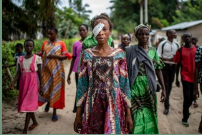
HAJDÚ D. András: Cataracta, 2022